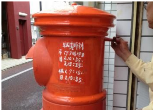
通りに戻ってきた郵便ポスト