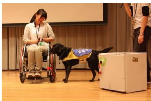
「介助犬のひろば in 柏原」